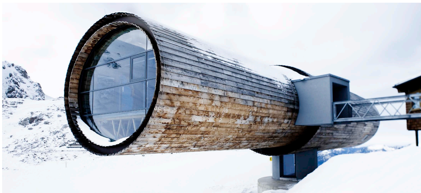
Bergstation Karwendel, Mittenwald

Dabei sind alle ORNILUX® Gläser wie andere Isoliergläser oder Verbundsicherheitsgläser ohne besondere technische Vorbedingungen oder Spezialwerkzeug einzubauen. Außerdem ist die Kombination mit anderen Funktionen wie Schall- und Wärmedämmung sowie Sonnenschutz problemlos möglich.